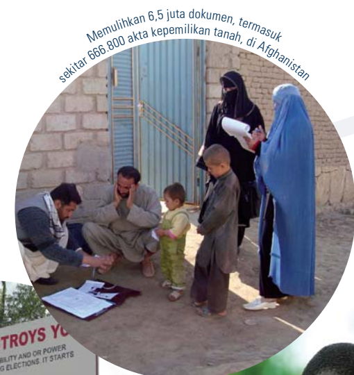
Memulihkan 6,5 juta dokumen, termasuk sekitar 686.800 akta kepemilikan tanah, di Afghanistan

Cardno bekerja sama dengan para pemangku kepentingan utama untuk merancang dan menerapkan strategi pengembangan sosial di berbagai bidang, mulai dari keamanan pangan dan pendidikan hingga perubahan iklim dan kesehatan. Sebagai contoh, Cardno merancang program senilai €95 juta di Malawi untuk meningkatkan produksi pertanian dan meningkatkan keamanan pangan. Di Indonesia, Cardno menghubungkan berbagai departemen pemerintah dengan sektor swasta untuk mengembangkan kurikulum sekolah dan melatih guru untuk 2.000 sekolah menengah di 240 kabupaten. Di Uganda, Cardno bekerja sama dengan perusahaan-perusahaan swasta untuk memperluas pelayanan kesehatan yang ditawarkan kepada karyawan dan keluarganya serta anggota masyarakat setempat. Hingga kini, proyek yang didanai USAID ini telah melayani lebih dari 350.000 orang. Cardno memperkuat prasarana sosial masyarakat untuk membekali para pemangku kepentingan lokal dengan bekal yang mereka perlukan untuk mencapai masa depan yang sehat dan berkelanjutan.