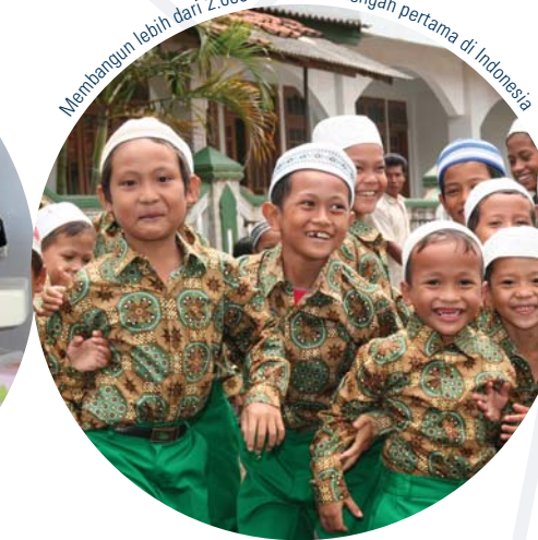
Membangun lebih dari 2.000 sekolah menengah pertama di Indonesia