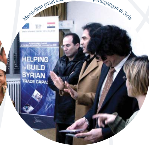
Mendirikan pusat analisa kebijakan perdagangan di Siria