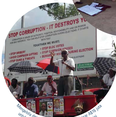
Mengelola dana perwalian (trust fund) sebesar A$16 juta untuk mendukung reformasi pemilu di Papua Nugini