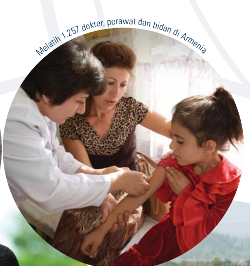
Melatih 1.257 dokter, perawat dan bidan di Armenia