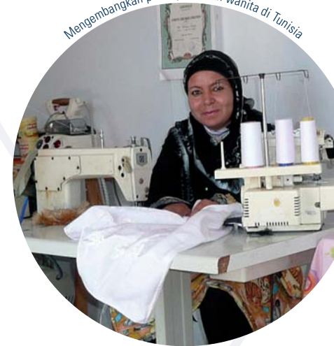
Mengembangkan pusat pelatihan wanita di Tunisia

Pendekatan kami untuk pengembangan keberlanjutan berakar dari kemitraan lokal . Mitra lokal merupakan anggota tim yang tak terpisahkan. Kami memberdayakan pemangku kepentingan lokal sebagai perancang pengembangan mereka sendiri dan kami juga memastikan bahwa hasil pengembangan didistribusikan secara luas. Sebagai contoh, Cardno memanfaatkan keahlian lokal di Ukraina untuk mendirikan Pusat Hukum Perdagangan yang didanai USAID, untuk mengaktifkan sektor swasta supaya dapat maju dan berkembang dalam ekonomi pasar. Pusat Hukum ini menjadi mandiri selama proyek dan terus mengembangkan infrastruktur hukum Ukraina hari ini.