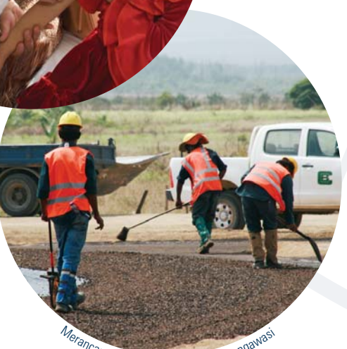
Merancang, melakukan tender dan mengawasi pembangunan jalan akses di Papua Nugini

Cardno membentuk masa depan melalui prasarana fisik, ekonomi dan sosial. Informasi lebih lanjut di www.cardno.com